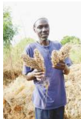
A köles betakarítása

„ Bekoor gi defa wañi am-am mu baykat aak sɔmmë yu néew doole yi. Porose bi suxaali na sama mbejub lejum. Legi mën na jangë, mën na xayma li may ligeey.” (Fatou Mbengue)