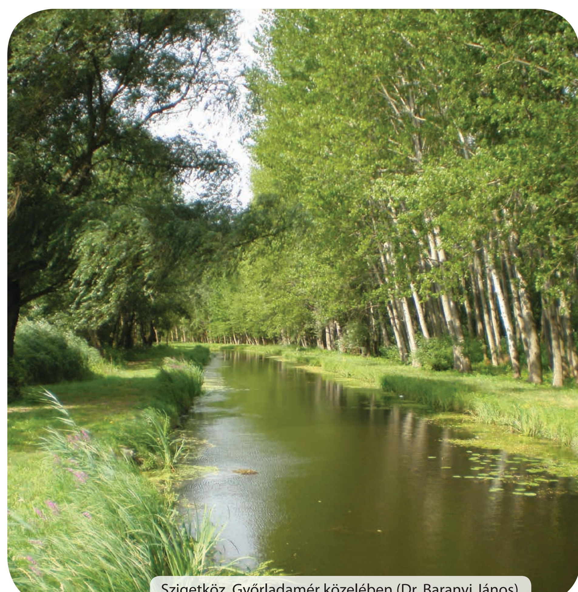
Szigetköz, Győrladamér közelében