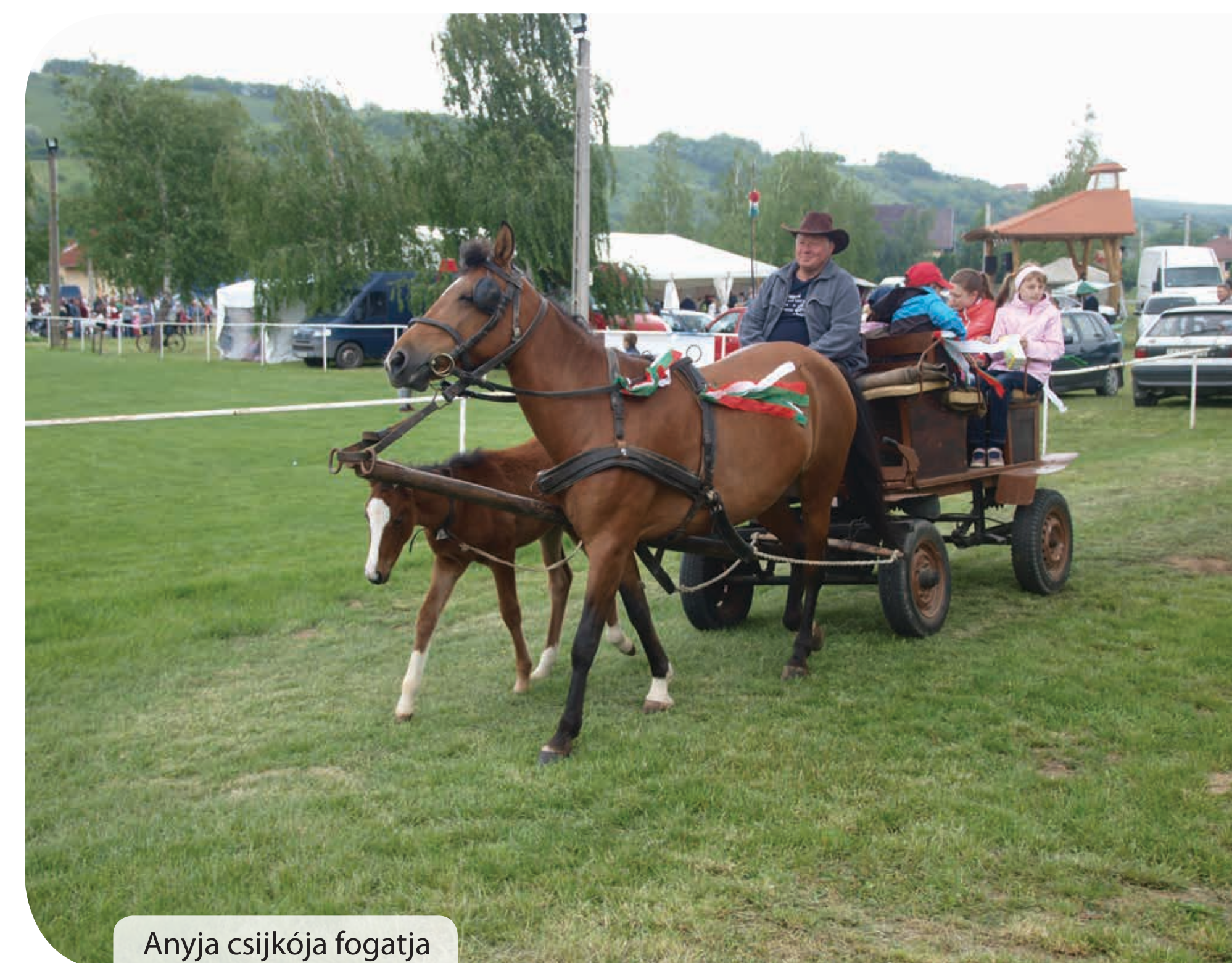
Anyja csikója fogatja