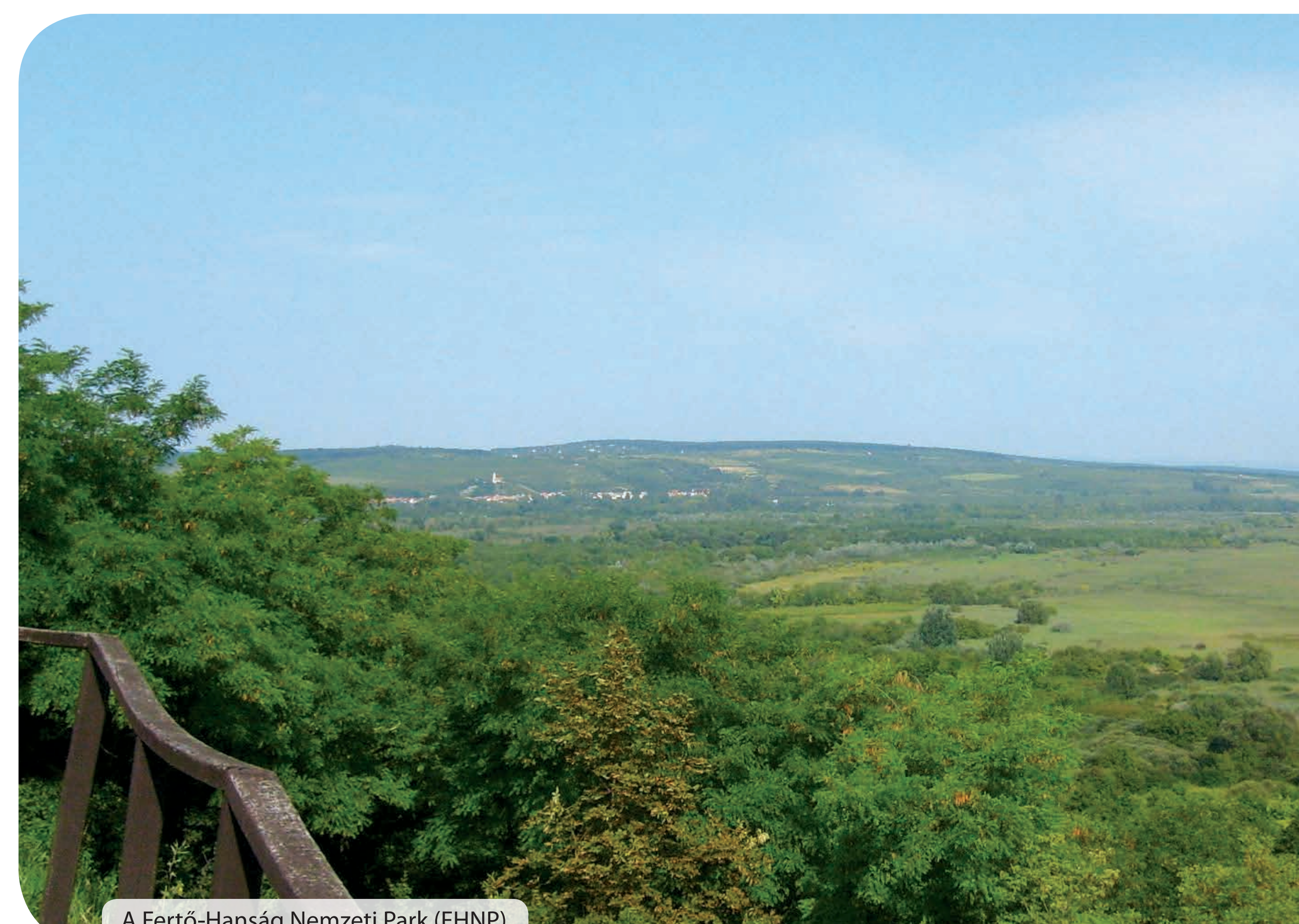
A Fertő-Hanság Nemzeti Park (FHNP)