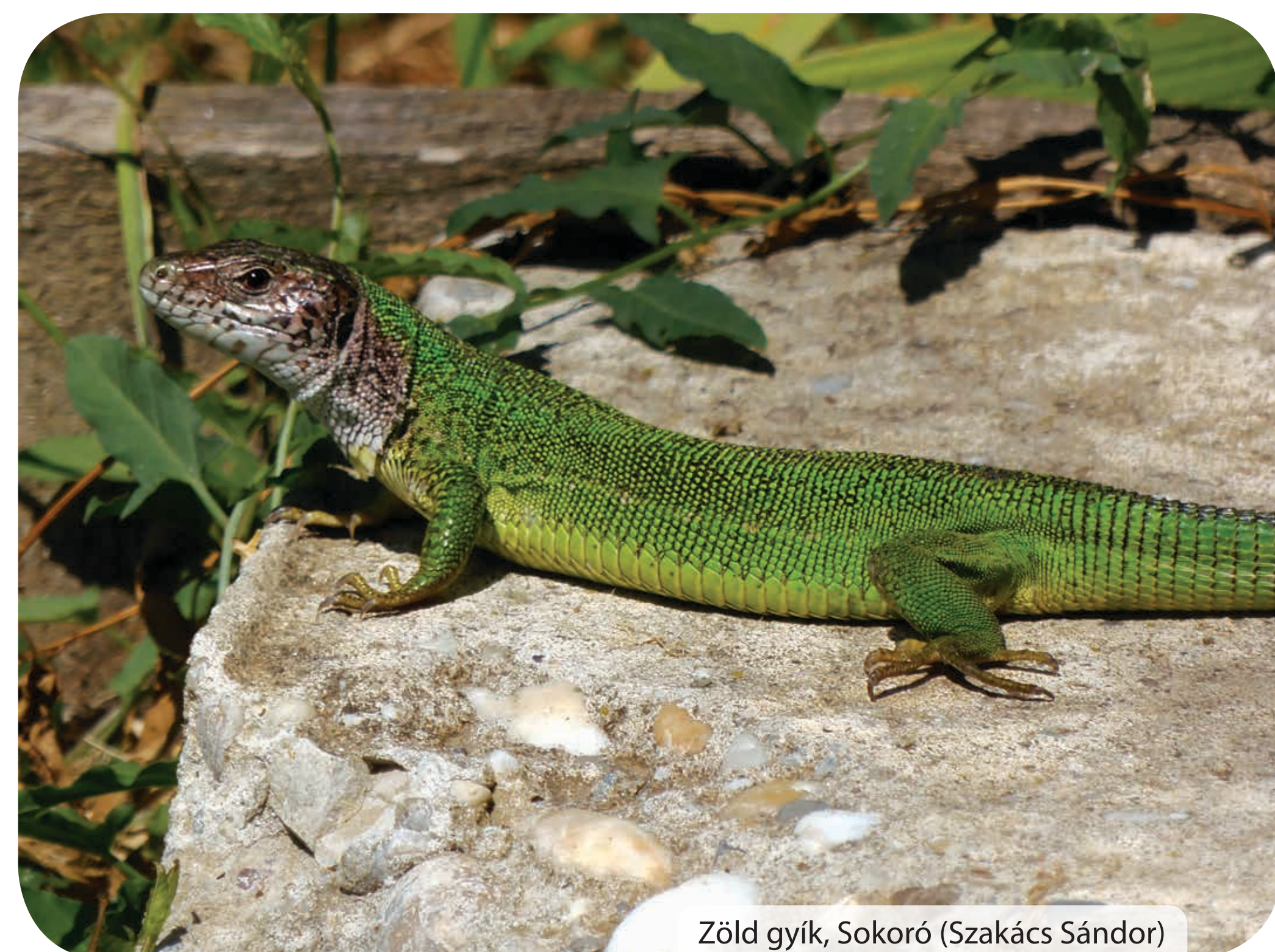
Zöld gyík, Sokoró (Szakács Sándor)