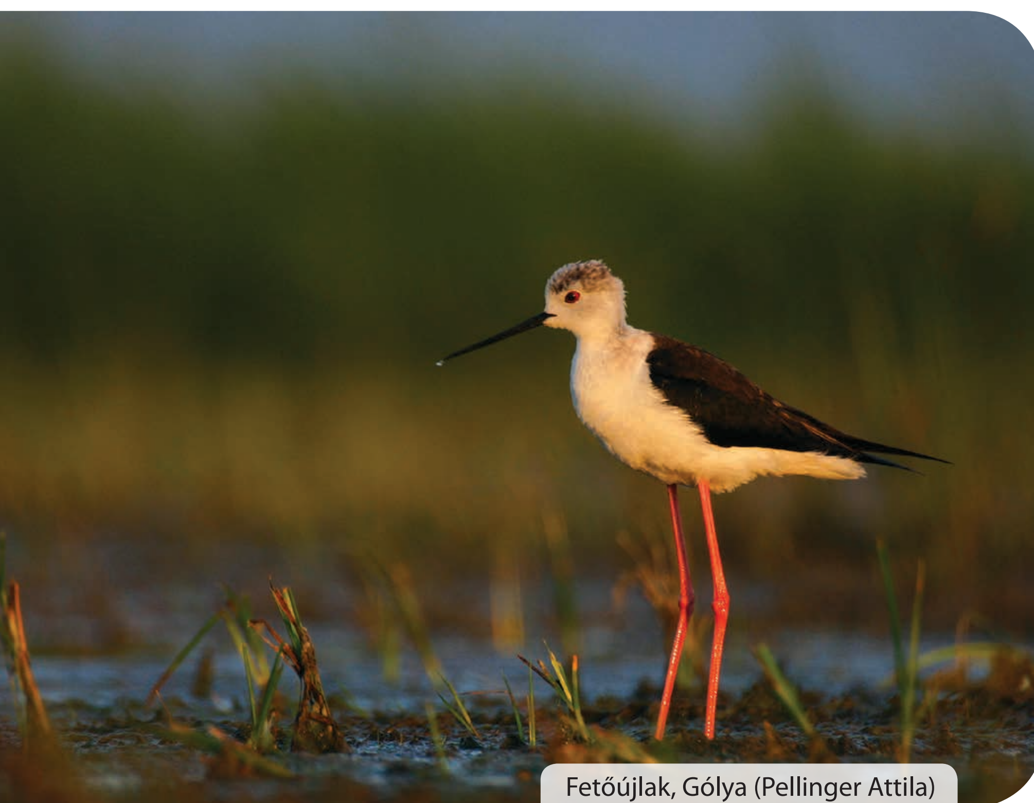
Fetőújlak, Gólya (Pellinger Attila)